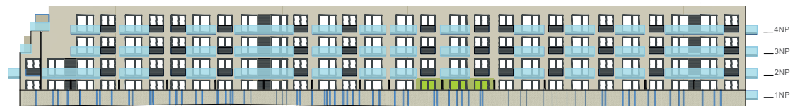
Jižní pohled na dům / Building View - south side